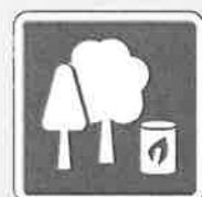
バイオマス燃料製造