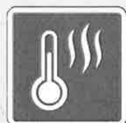
温度差エネルギー利用