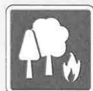
バイオマス熱利用